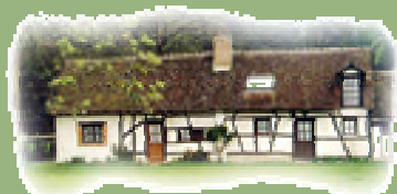
«Le Domaine du Boulay »