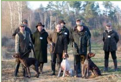
Barrage Chiens d'arrêt